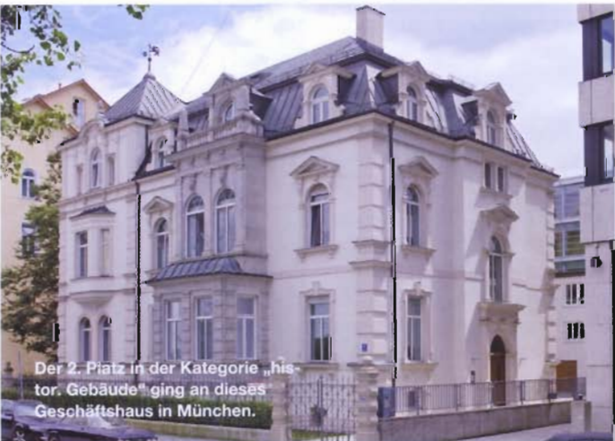
Der 2. Platz in der Kategorie „histor. Gebäude“ ging an dieses Geschäftshaus in München.

Der 1. Preis in dieser Kategorie zeichnet die feine Leistung eines Betriebes aus, der sich auf Instandsetzung und Erhalt von Gebäuden spezialisiert hat: die Firma Mattsichent aus Langenhagen. In Hannover sanierte das Bauunternehmen die Fassade eines 1907 im Jugendstil erbauten Eckhauses vollständig. Beeindruckt zeigte sich die Jury, welch großer Wert dabei darauf gelegt wurde, die vorgefundenen Putzstrukturen sowie stilgebundenen Elemente zu erhalten bzw. zu reproduzieren. „Sowohl die rot glasierten Zierfliesen wie auch große Teile der Ornamentik spiegeln wieder, mit wie viel Liebe zum Detail und Sachverstand die Sanierung erfolgte“, befand das Preisgericht. Die Bearbeitung der Fassade zeuge von hohem Respekt vor dem Bestehenden und großem handwerklichen Geschick. Eine