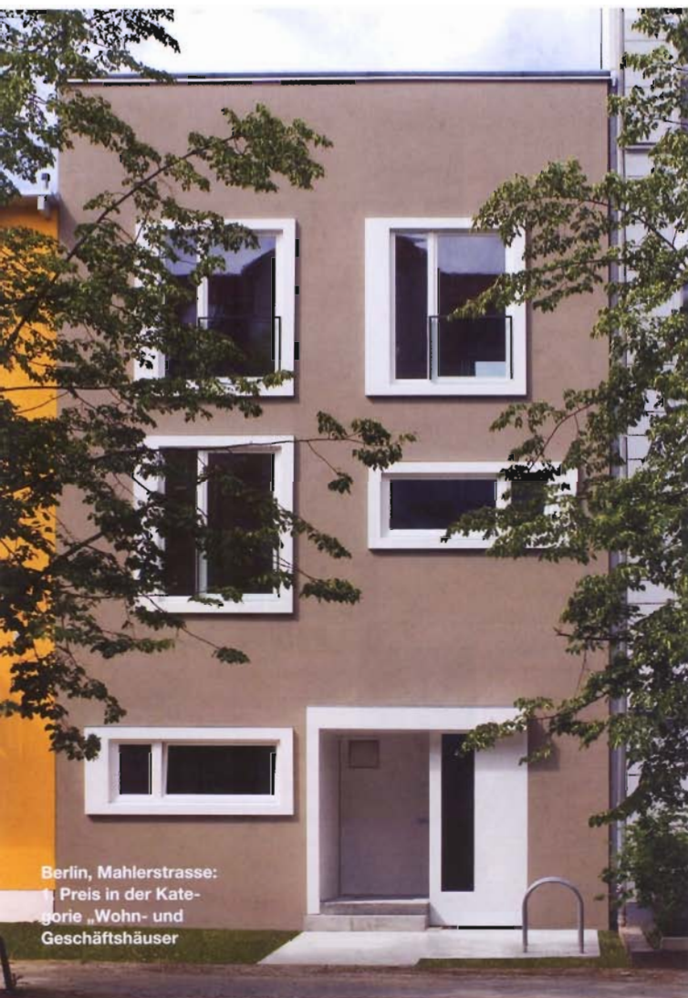
Berlin, Mahlerstrasse: 1. Preis in der Kategorie „Wohn- und Geschäftshäuser“

Meisterschaft in der farbigen Fassadengestaltung ist keine Frage der Region oder der Betriebsgröße der ausführenden Handwerker: Das zeigt das Wettbewerbsergebnis des Deutschen Fassadenpreises 2008 deutlich. Die Preisträger kommen in diesem Jahr aus allen Himmelsrichtungen der Republik. Für hervorragende Umsetzungen zeichnete der Wettbewerb sowohl Kleinbetriebe wie Firmen mit mehreren Dutzend Mitarbeitern aus.