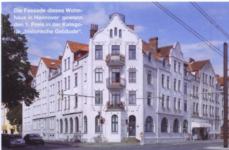
Die Fassade dieses Wohnhaus in Hannover gewann den 1. Preis in der Kategorie „historische Gebäude“.

geglückte Verbindung, die der Deutsche Fassadenpreis 2008 mit der höchsten Auszeichnung in dieser Kategorie prämierte.