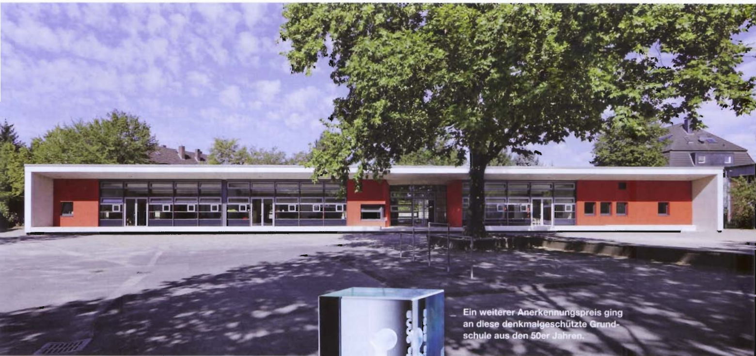
Ein weiterer Anerkennungspreis ging an diese denkmalgeschützte Grundschule aus den 50er Jahren.