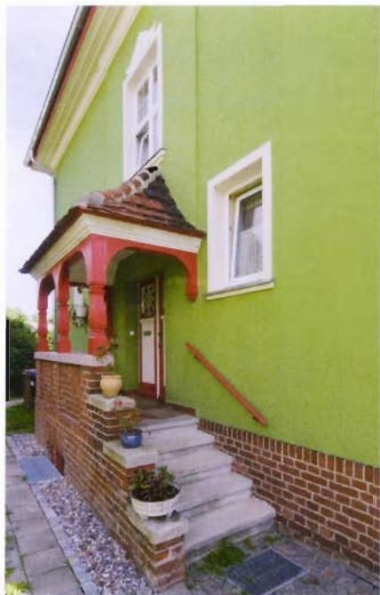
Diese Villa in Frankfurt (Oder) bekam einen zweiten Preis.

Mehrfamilienhaus von 1908 war nach einem lieblosen Anstrich in den 1960er-Jahren nichts mehr von der ursprünglich reichen ornamentalen Bemalung übrig. Mit der Vergabe des 3. Preises in der Kategorie „Historische Gebäude und Stilfassaden“ zeichnete die Jury die Malerwerkstätten Heinrich Schmid (Zwickau) und Baum Meyer Nagel + Partner Architekten (Nürnberg) für die mustergültige Renovierung dieser Jugendstilfassade aus.