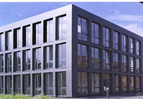
Das Bürogebäude der Schachanlage in Lünen erhielt eine Anerkennung.