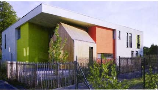
Einen ersten Preis erhielt die außergewöhnliche Kindertagesstätte in Neuss.