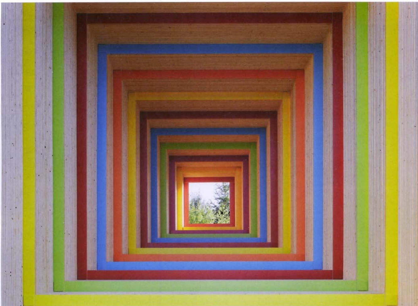
Die „Sehstation“ dient der Sensibilisierung der Öffentlichkeit für die gebaute Umwelt. Die begehbare Installation aus Holzlamellen vermittelt einen perspektivischen Farbraum mit erstaunlicher Tiefe. Sie wurde mit einem Sonderpreis ausgezeichnet.

Gleich zu Beginn der Sitzung zeigte sich die elfköpfige Jury erfreut, dass sich das diesjährige Teilnehmerfeld mit Objekten des Baujahres 2008 auf alle vier ausgelobten Kategorien erstreckte. Neben den traditionell zahlreichen Einreichungen aus den Bereichen Wohn- und Geschäftshäuser, Öffentliche Gebäude sowie Historische Gebäude und Stillfassaden bewarben sich beim Wettbewerb 2009 auch viele gelungene Arbeiten für die Kategorie Industrie- und Gewerbebauten. Nach intensiver Diskussion der durchweg hochwertigen Wettbewerbsbeiträge und drei Durchgängen einigte sich das Preisgericht auf elf Preisträger, die die gewünschte enge Korrespondenz zwischen Architektur und Fassadenfarbigkeit, zwischen Kreativität und sensibler Gestaltung sowie eine besondere Meisterschaft in der Ausführung auf herausragende Weise verwirklichten.