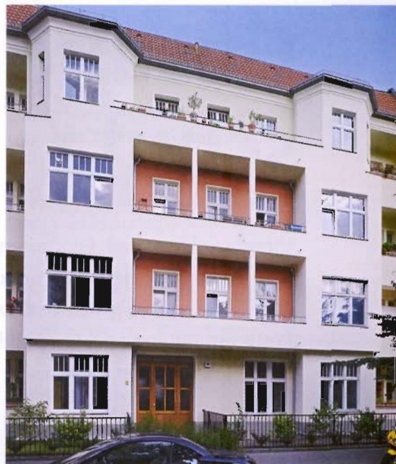
Dieses Berliner Wohnhaus wurde mit einer Anerkennung belohnt.

Über Farbe in der gebauten Lebensumwelt kann man sprechen – oder sie am Objekt erleben. Selten gelingt es jedoch, mit wenigen Schritten so viele unterschiedliche Perspektiven auf bestehende Bauten und den Kontext farbiger Wirkungen zu erhaschen wie mit der „Sehstation“, die seit 2008 und noch bis 2010 durch verschiedene Städte Nordrhein-Westfalens tourte. Die mobile Installation aus Holzlamellen ist als begehbare Okular geformt, das die Blicke auf die gebaute Umgebung lenkt. In sich ist der sich verjüngende Quader abgestuft; die Stufensprünge wurden mit farbigen Akzentuierungen rahmenartig in frischen, reinen Tönen hervorgehoben. Konzipiert und umgesetzt haben diese „fliegende Ausstellung“ die Augsburgburger Zimmerei Bernd