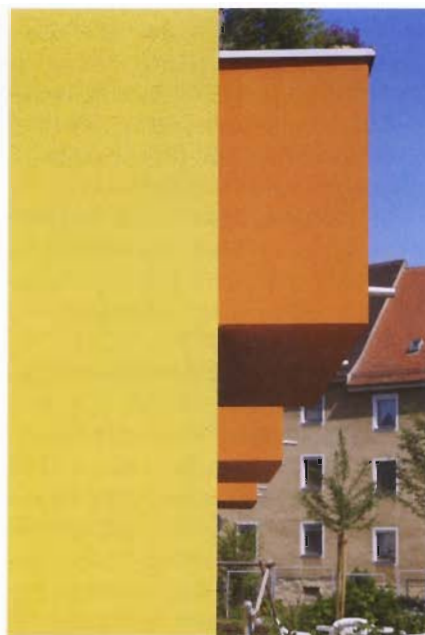
An diese Wohnanlage in Regensburg ging ebenfalls ein zweiter Preis.