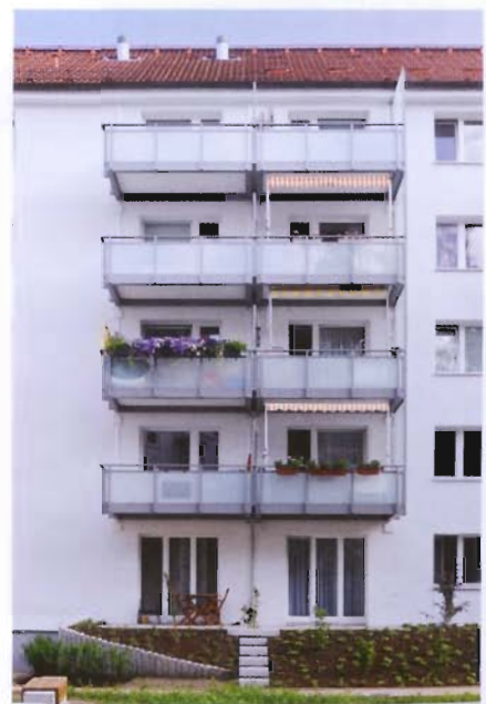
Mit einem Förderpreis wurde dieses Wohnquartier in Hamburg bedacht.