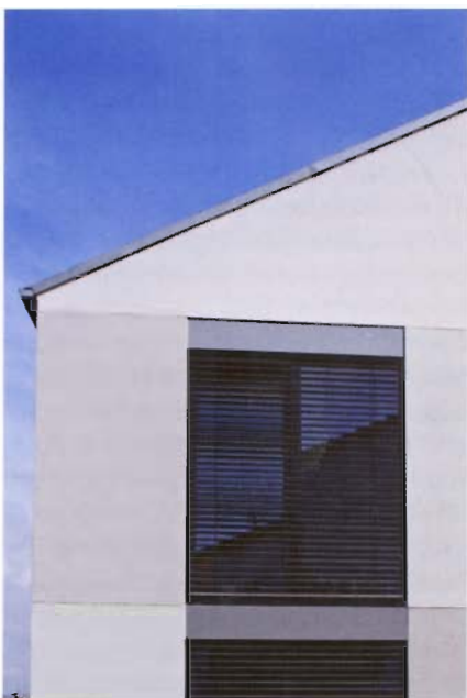
Dieses Wohnhaus in Saarbrücken erhielt einen zweiten Preis.

Öffentliche Gebäude sind nicht zuletzt Schrittmacher für Innovationen. Was sie vormachen, wird früher oder später