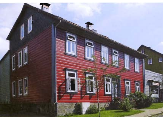
Die Jury vergab an das mit Holz verschaltete Mehrfamilienhaus einen ersten Preis.

zum Allgemeingut in der Baukultur. Der konzeptionelle Anspruch – ansprechende Fernwirkung im Stadtbild und stimmige Nahwirkung auf die Nutzer – ist daher in diesem Bereich besonders hoch. Vorbildlich erfüllt hat diese Vorgabe beim Deutschen Fassadenpreis 2009 eine Kindertagesstätte in Neuss-Reuschenberg. Der moderne kubische Baukörper ist zur Straßenseite hin aufgebrochen und zeigt einen erfrischenden Blickfang: Dort stülpt sich die Gebäudeecke schützend über ein farbig belebtes Häuschen aus Holz, das den Maßstab der Nachbarschaft aufgreift. Sechs Bunttöne, ein Weiß- und ein Grauton bilden die auf den ersten Blick gewagte Farbpalette. Die Jury würdigte diese feine Leistung mit einem 1. Preis für Maler Weiß aus Essen und das Düsseldorfer Atelier Fritschi - Stahl - Baum Architekten.