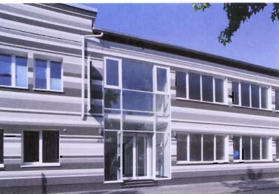
Ein Metall verarbeitendes Unternehmen in Wuppertal bekam einen ersten Preis.